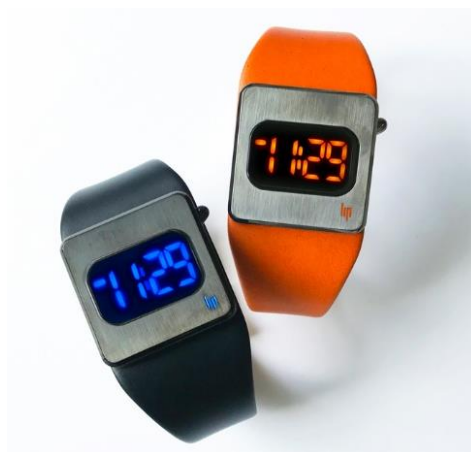
「マツハ 2000 ダイオード」