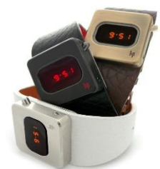
1976 年発売当時のモデル

スクエアフォルムのケースデザインと表示ディスプレイに点灯するダイオードの光は、どこかレトロフューチャーを感じる、タイムレスで優れたデザイン。発売当時、ダイオードのカラーはレッドのみでしたが、今回のモデルは現代の LED 技術を取り入れ、ブルー/オレンジを採用しました。デザインはより現代的になった一方で、機能は当時とほとんど変わることなく、ボタンを押したときにだけ時刻が表示される特徴的な仕組みも、今回の復刻の魅力です。