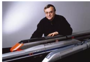
デザイナー「ロジェ・タロン」

LIP社は、1867年にフランス東部の街、ブザンソンで創業したフランスを代表するウォッチブランドです。フランスを代表する時計ブランドとして、自国のドゴール首相や英国チャーチル首相にも贈呈された歴史があります。クラシックな時計作りに長けていた一方、フランスを代表するデザイナー、ロジェ・タロンによる左右非対称の斬新なデザインの“マツハ 2000”シリーズを1975年に発表するなど、フレンチデザインを象徴するプロダクトも生み出しています。時代を経ても色褪せないフレンチデザインと、2017年に150周年を迎えた長い時計製造の歴史に基づいたLIPのコレクションは、近年パリを中心にフランスの幅広い世代に再評価され、フランスのTV番組でも取り上げられています。